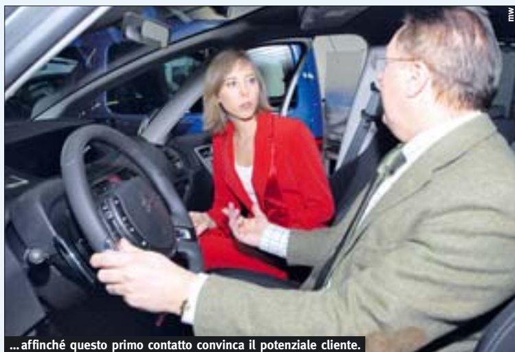
... affinché questo primo contatto convinca il potenziale cliente.